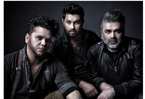
Magna Cum Laude

A kétnapos fesztivál a MOL Nagyon Balaton! rendezvénysorozat részeként kerül megrendezésre. A versenyt kísérő programok két napon át várják vízen és szárazföldön a látogatókat. A Honeybeast és a Magna Cum Laude szombaton lép fel, az Apacuka és a The Biebers a vasárnapi partihangulatot biztosítja. Finom ízekben és italokban sem lesz hiány: a települések főzőverseny keretében mutatják be legfinomabb étkeiket. Az esti hangulatot lampionos felvonulás fokozza majd.