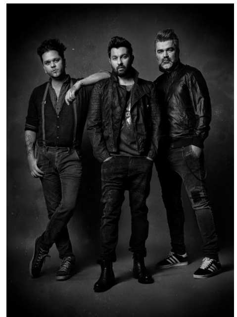
Magna Cum Laude

„17 év alatt remek dalaink születtek, nem egyszerű feladat a listát összeállítani, mindenkinek megvan a kedvence, vannak mondhatni kötelező számaink. Elő szoktuk venni a régebbi dalainkat is, szeretjük a változatos koncerteket! Jöjjenek minél többen! 2 napos szuper családi buli a Balaton partján, víz, napsütés, vitorlásverseny, főzőverseny és persze este Magna koncert!”